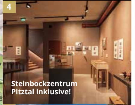
4 Steinbockzentrum Pitztal inklusive!