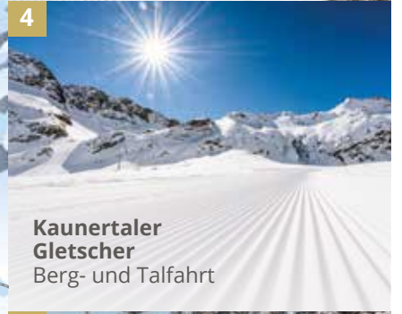
4 Kaunertaler Gletscher Berg- und Talfahrt