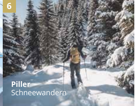
6 Piller Schneewandern