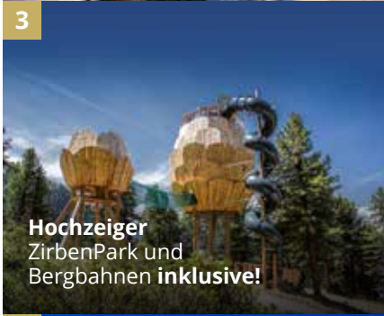
3 Hochzeiger ZirbenPark und Bergbahnen inklusive!