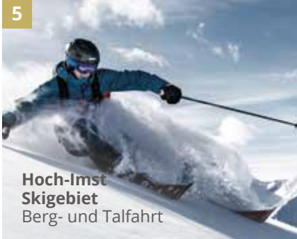
5 Hoch-Imst Skigebiet Berg- und Talfahrt