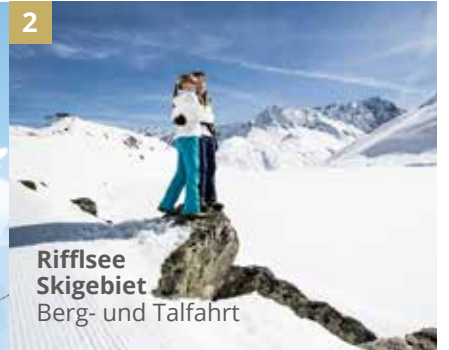
2 Rifflsee Skigebiet Berg- und Talfahrt