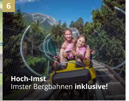
6 Hoch-Imst Imster Bergbahnen inklusive!