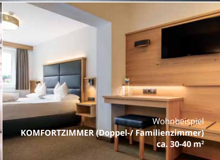
Wohnbeispiel KOMFORTZIMMER (Doppel-/ Familienzimmer) ca. 30-40 m 2