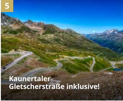
5 Kaunertaler Gletscherstraße inklusive!