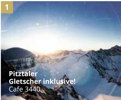
1 Pitztaler Gletscher inklusive! Cafe 3440