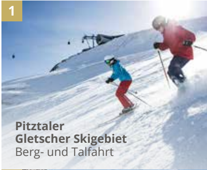
1 Pitztaler Gletscher Skigebiet Berg- und Talfahrt