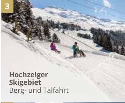
3 Hochzeiger Skigebiet Berg- und Talfahrt