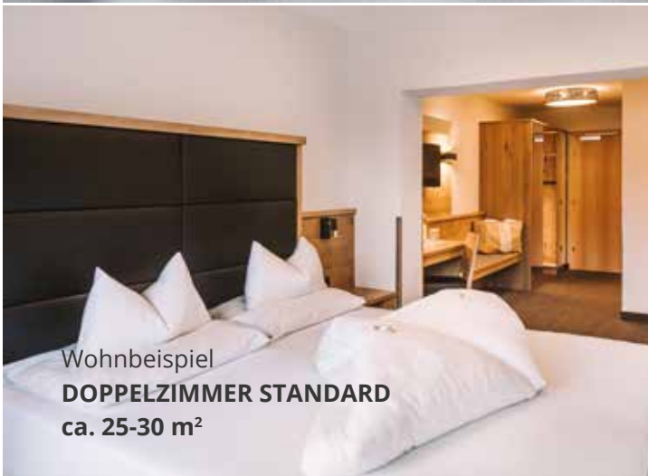
Wohnbeispiel DOPPELZIMMER STANDARD ca. 25-30 m 2